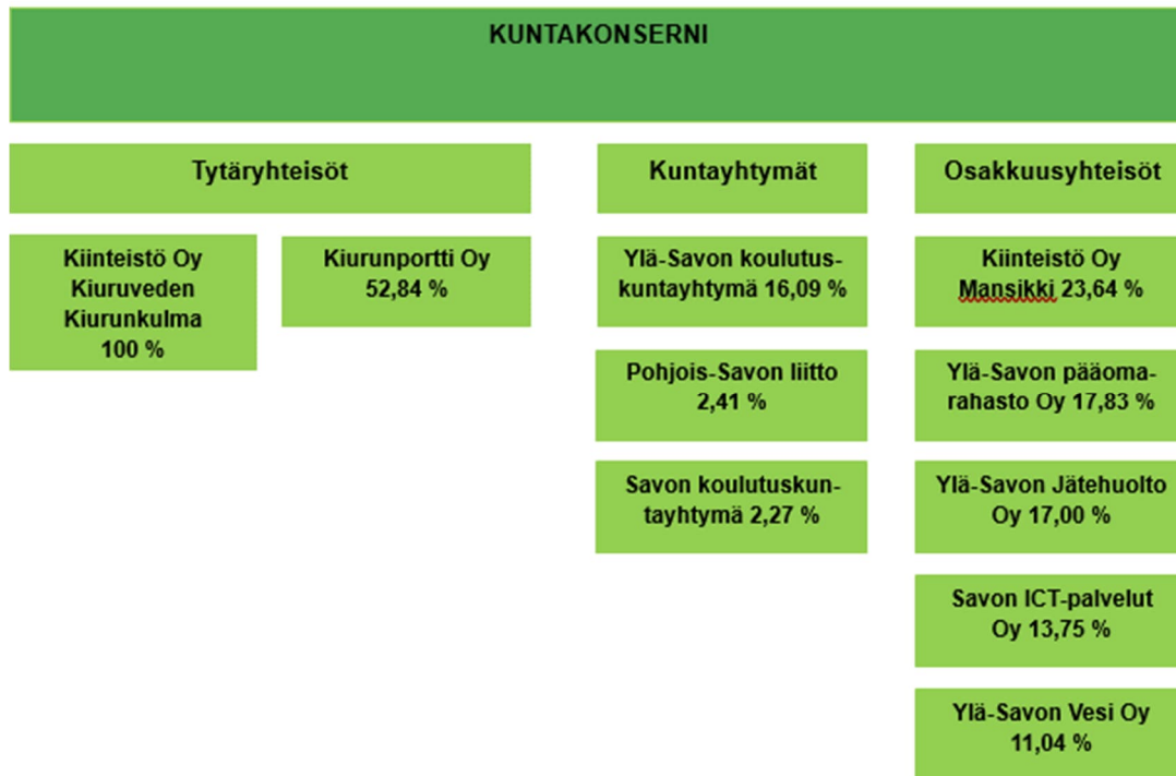
Kuva 1: Kiuruveden kaupungin konsernin tilinpäätökseen sisällytetyt tytäryhteisöt, kuntayhtymät ja osakkuusyhteisöt.

Kiuruveden kaupungin omistusprosentit Kiinteistö Oy Mansikista ja Savon ICT-palveluista ovat pienentyneet vuonna 2025 osakkuusyhteisöissä tapahtuneitten muutosten takia. Rautalammin mukaan tuleminen Savon ICT-palveluihin pieneni Kiuruveden omistusprosenttia 14,2 %:sta 13,75 %:iin. Kiuruveden kaupungin omistusprosentti Kiinteistö Oy Mansikista pieneni 26,28 %:sta 23,64 %:iin, kun OK Peeässä hankki varastotilan Kiinteistö Oy Mansikilta.