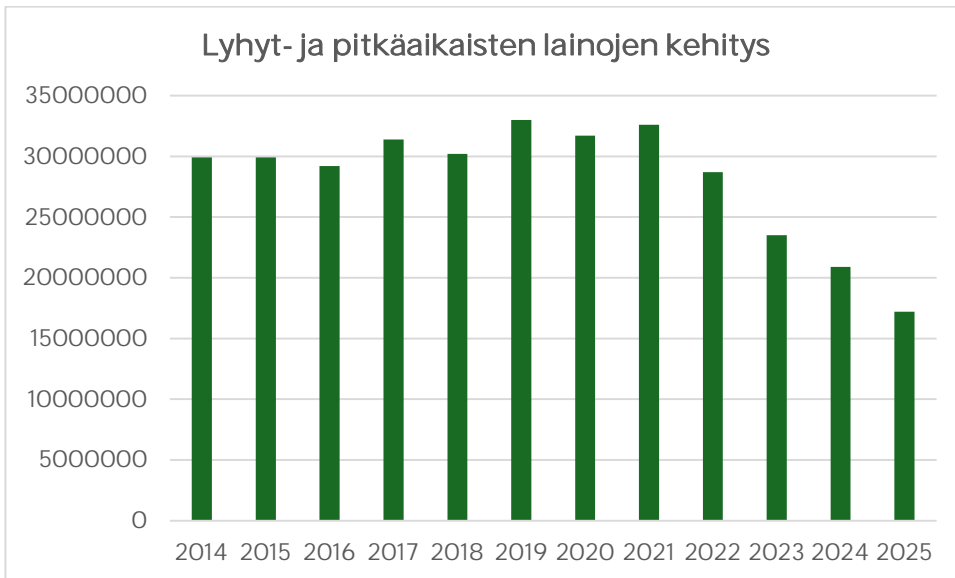
Kaavio 1: Lyhyt- ja pitkäaikaisten lainojen kehitys vuosina 2014–2025