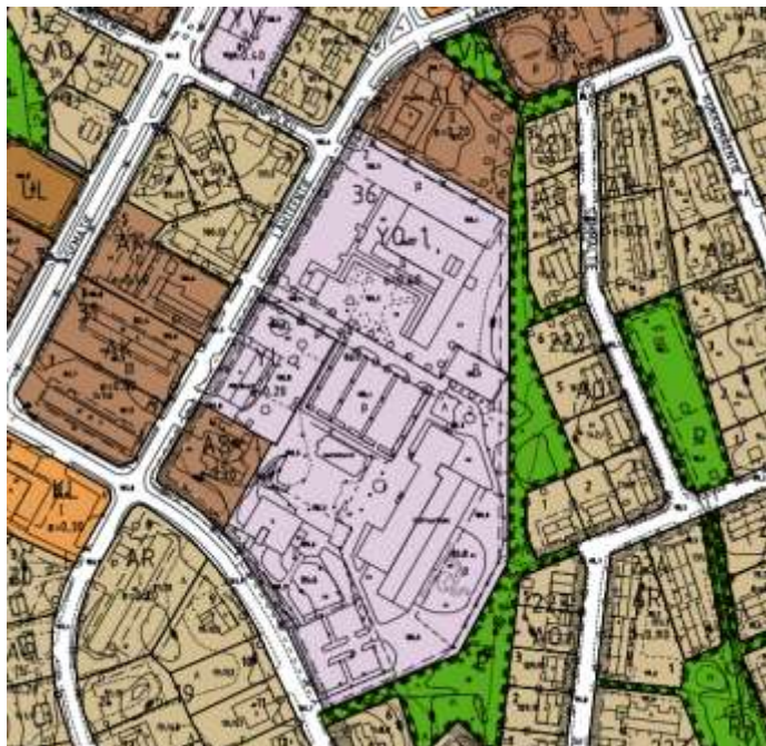
Ote voimassa olevasta asemakaavasta

Suunnittelualueen asemakaava on tullut voimaan vuonna 2006. Suunnittelualue on varattu